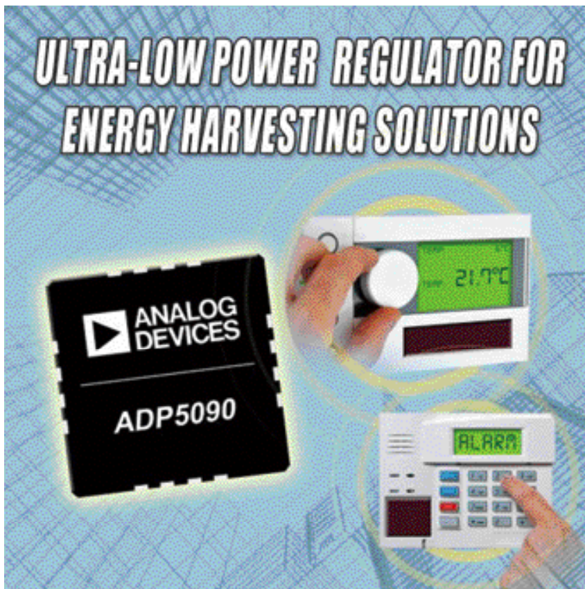
圖 4：ADI 針對能量採集系統推出超低功耗升壓型穩壓器